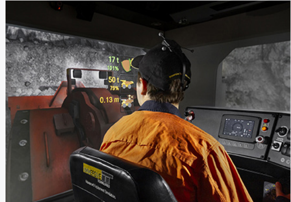
Simulator Shovel Hidraulik/Ekskavator (Diesel) Komatsu PC7000-11 , Shovel Hidraulik (Elektrik) PC8000E-6, PC7000E-11, and Simulator Underground Loader Sandvik Toro LH517i.

Untuk pelanggan Autonomous Haulage, Immersive Technologies terus mengembangkan rangkaian produk untuk beberapa kelompok mesin dan model mesin. Kami menawarkan kepada pelanggan kami beberapa solusi dukungan otonom Komatsu, mulai dari pelatihan Kendaraan Ringan, Excavator, Hydraulic Shovel, Electric Rope Shovel, Wheel Loader, Dozer, Grader, dan Manual Haul Truck. Untuk pelanggan yang mengoperasikan dukungan sistem otonom Caterpillar®, kami menawarkan pelatihan untuk produk Ekskavator, Shovel Hidraulik, Rope Shovel Elektrik, Wheel Loader, Dozer, dan Grader. Rangkaian solusi pelatihan yang komprehensif mencakup eLearning, simulasi desktop (ruang kelas virtual), pemeriksaan mesin pre-start (model interaktif 3D layar sentuh), tambahan pada panel sistem pengangkutan otonom untuk simulator, dan skenario berbasis VR untuk berbagai skenario operator dan supervisor. Beberapa pelanggan yang telah menggunakan produk ini meliputi Rio Tinto, Anglo American, BHP, FMG, AMSA, Codelco, Teck, Vale, dan Boliden.